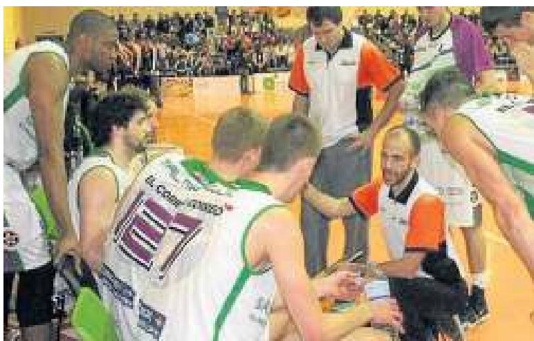
El Araberri sumó una nueva victoria en Morón.

El Aceitunas Fragata continuó recorriendo distancias en el tercer cuarto hasta que dos triples consecutivos dieron la vuelta al electrónico (51-51). A cinco minutos del final llegó el momento de Smith. Anotó 8 puntos consecutivos y puso por delante a su equipo, 60-63, pero Aceitunas Fragata reaccionó de nuevo. A 30 segundos para el final, los sevillanos se pusieron con un 73-71 que parecía definitivo pero Smith sentenció y dio al Sáenz Horeca su quinto triunfo. –DNA