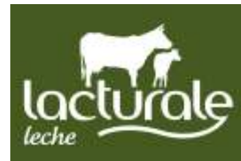
Logo de la firma navarra.

VITORIA – Buenas noticias, económicas en este caso, para el Araski de cara a su inminente participación en el play off de ascenso a Liga Femenina. El conjunto alavés ya tiene patrocinador principal a quien le otorgará un lugar destacado en la camiseta de juego, Lacturale, que para esta fase de ascenso manchará además el nombre oficial del equipo rebautizándolo como Lacturale Araski. El acuerdo es inicialmente para la fase final de esta histórica temporada aprovechando la participación en la Fase de Ascenso a Liga Femenina, pero con el deseo mutuo de que la colaboración se extienda en las próximas temporadas. El Grupo Lacturale fue fundado en el año 2005 por 25 ganaderos de Navarra que decidieron unirse para comercializar la leche producida en sus explotaciones. Desde el esfuerzo y la innovación, en octubre de 2008 S.A.T Lacturale lanzó su propia marca de leche, denominada Lacturale, primera y única leche certificada en producción integrada de Navarra. Una decidida apuesta por la calidad y la sostenibilidad que beneficia a todos, pero sobre todo al consumidor. El apoyo de la firma navarra se une al de otras empresas como DIARIO NOTICIAS DE ÁLAVA, que también manchará la camiseta, en este caso la que llevará la afición en su expedición hasta tierras cacereñas. – DNA