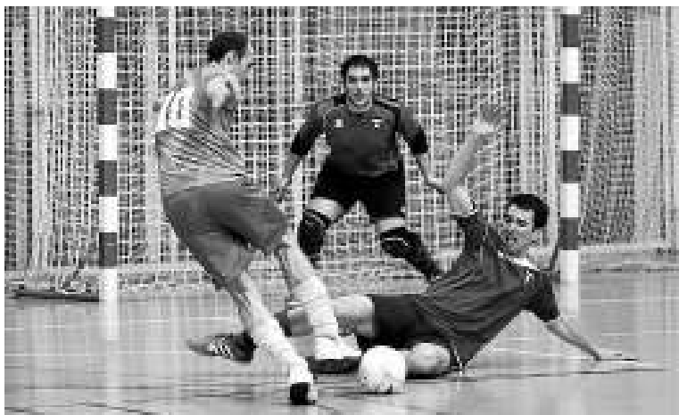
Labastida y Aurrera afrontan citas importantes.

Ambos llegan a esta importante cita tras haberse hecho con la victoria en la pasada jornada de la Liga de Segunda B