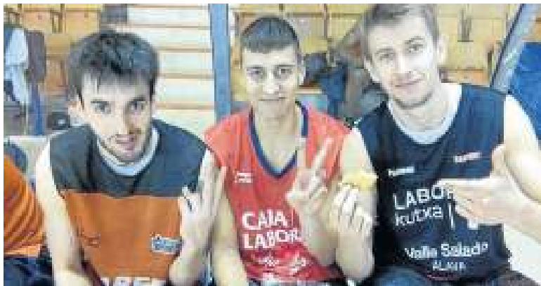
El Araberri está ahora mismo en dinámica positiva.

VITORIA – Regresa la LEB Plata a Mendizorrotza esta tarde con un duelo donde el Sáenz Horeca buscará mantener la segunda plaza ante el Aceitunas Fragata Morón. El conjunto sevillano es uno de los equipos más peligrosos de la liga a domicilio, motivo por el cual los gasteiztarras quieren tener los pies en el suelo. Morón ocupa la séptima plaza con 11 victorias y 10 derrotas y llega a este encuentro tras triunfos contundentes y con la moral muy alta. Tras ocupar las primeras plazas de la clasificación –Araberri les venció en su feudo cuando ocupaban el primer puesto–, una pequeña crisis de resultados