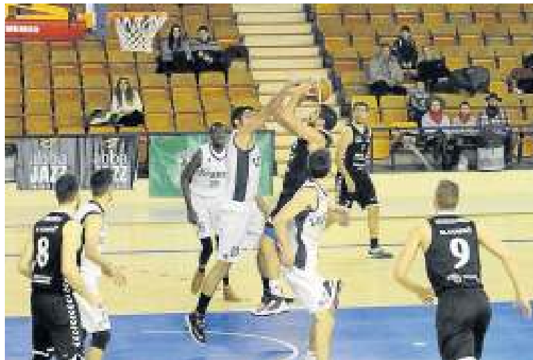
El Araberri, con su tercer técnico del curso, luchó por la victoria.

Pese al marcador final, no salió excesivamente malparado el Araberri de un partido al que compareció diezmando por la sensible ausencia de su mejor jugador (Yates) y en el que, sin embargo, dio con la tecla