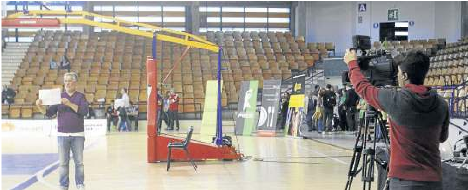
Para la retransmisión del partido se utilizaron dos cámaras con operador y otra más en formato Go Pro, situada encima de la canasta.

161 en los Estados Unidos, 2 en Pakistán, 1 en Hong Kong, Alemania o Brasil, y 4 en Dinamarca. Destinos dispares para una mentalidad global, perfecta en una filosofía sin fronteras como la del streaming , cuyo margen de explotación es en estos momentos muy bajo dentro del campo amateur. Por eso como quiera que en Araski los deberes en este nicho hace ya un tiempo que se pusieron en marcha, las perspectivas de crecimiento son muy halagüeñas. Otro de los datos que ofrece la plataforma Fénix son las conexiones totales y los visitantes únicos totales. En ambos casos, según las