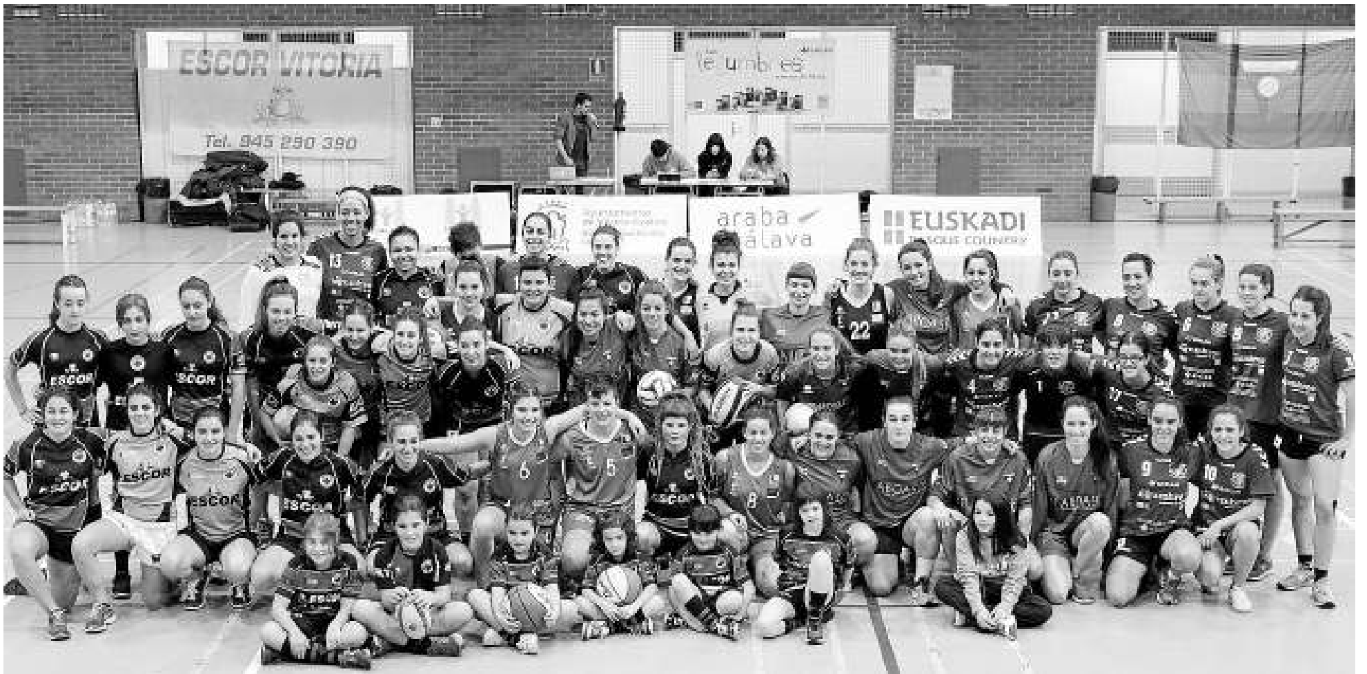
La visibilización del deporte femenino volvió a dar un paso más el domingo en la cancha de Judimendi, donde se dieron cita clubes como el Araski, Aurrera, Gaztedi o Ehari.