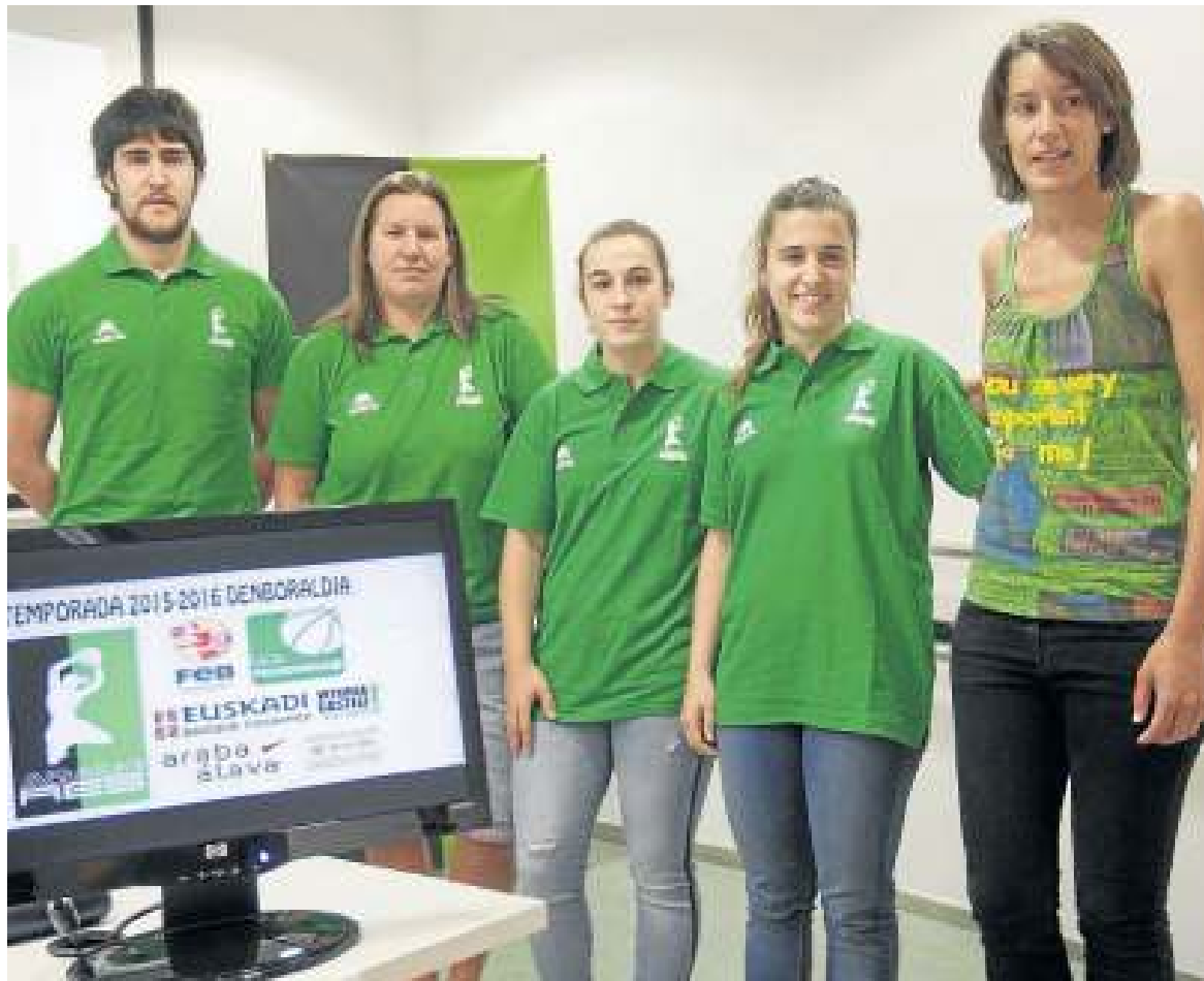
Los responsables del Araski presentaron ayer la nueva temporada.

De esta manera, serán cuatro las jugadoras que continúen respecto a la temporada pasada. Se trata de