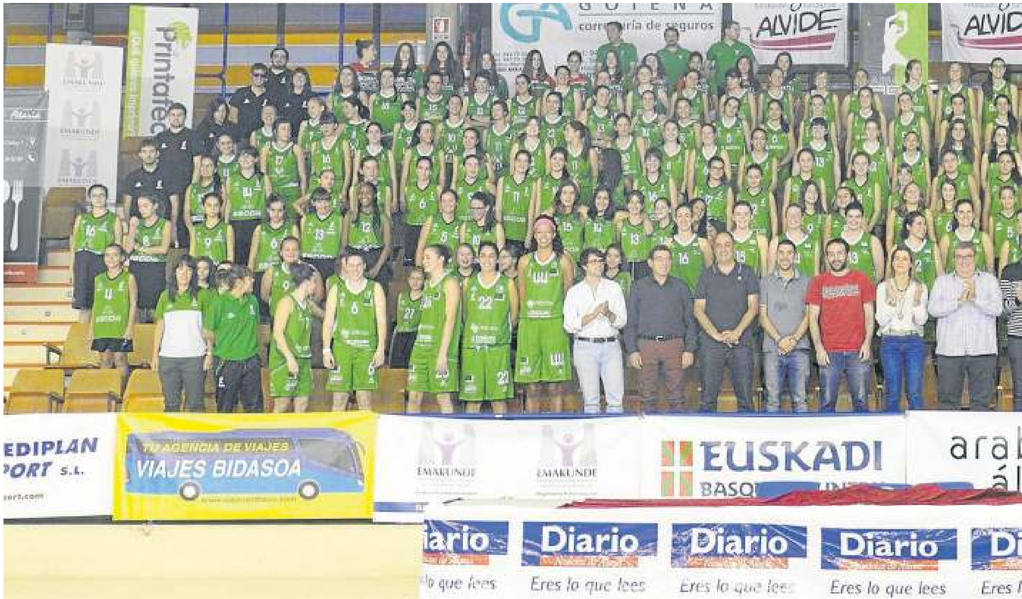
Todos los integrantes de la amplia estructura deportiva del Araski posaron el pasado sábado en las gradas de Mendizorroza.