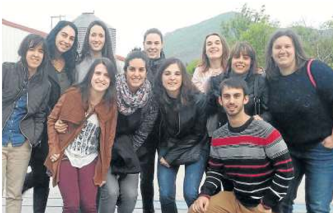
La plantilla se acercó ayer hasta la granja modelo de Lacturale en la localidad navarra de Etxeberri.