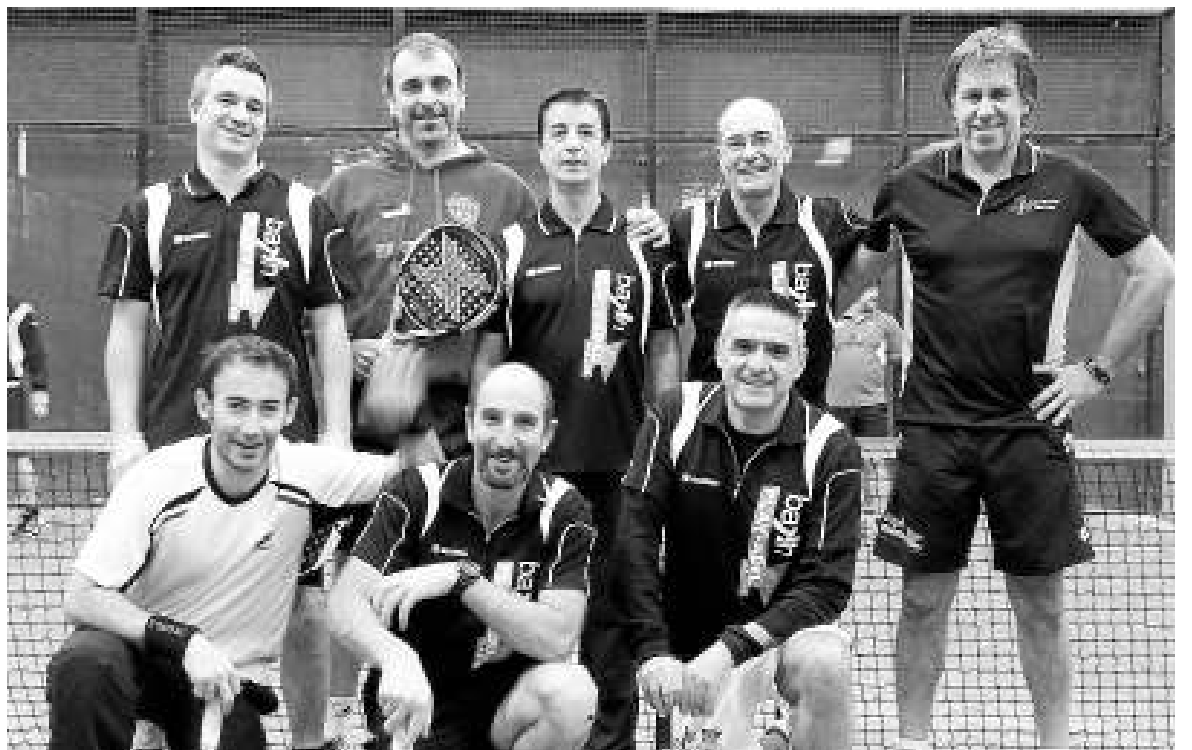
Imagen de los veteranos del Play Padel que se impusieron el pasado fin de semana.

PARTICIPACIÓN FEMENINA En categoría femenina, la victoria en este caso fue para las chicas de Padel Virtual tras vencer en la final al conjunto de la Peña Vitoriana por un resultado de 2 a 1. En segunda, la victoria fue para Padel Lakua, por delante de los chicos de la Peña