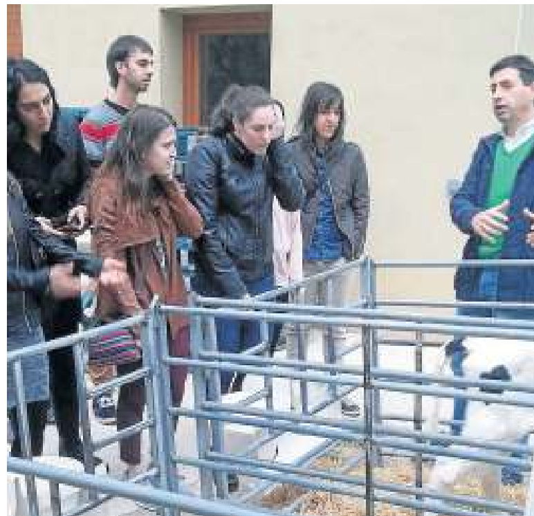
El presidente, explicando su filosofía.