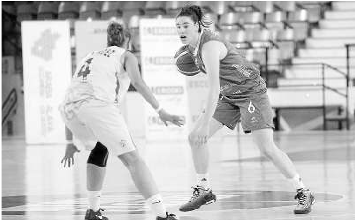
La base Arrate Agirre es una de las referentes del Araski.

Sin miedo. Así encara el bloque el duelo ante el líder. Un Al-Qazeres Extremadura que dirigido por Jacinto Carvajal tiene probablemente el mejor plantel de la categoría. “Tienen un quinteto perfecto, equilibrado, 100% compatible y con un gran