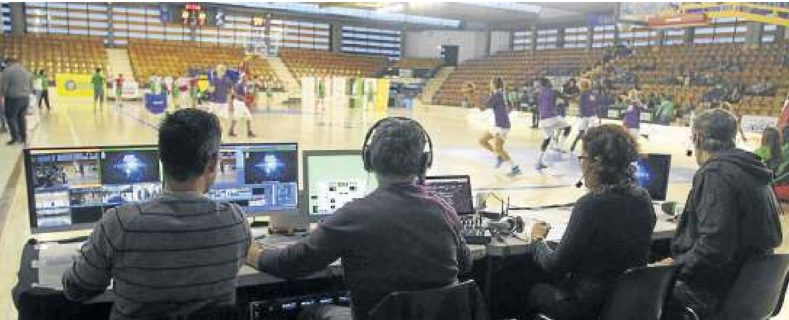
Con la del sábado son ya siete las veces que un partido del Araski ha sido retransmitido a través de ‘streaming’.

cifras registradas el sábado, la directiva del club puede estar más que satisfecha, ya que a lo largo del partido tuvo 1.194 conexiones o “pinchazos”, es decir, número de veces que se accedió a la emisión, siendo el picó máximo de audiencia a las 21.17 horas, en los segundos finales del partido. En ese preciso instante, casi 70 personas repartidas por el mundo estaban viendo en directo el partido del Araski.