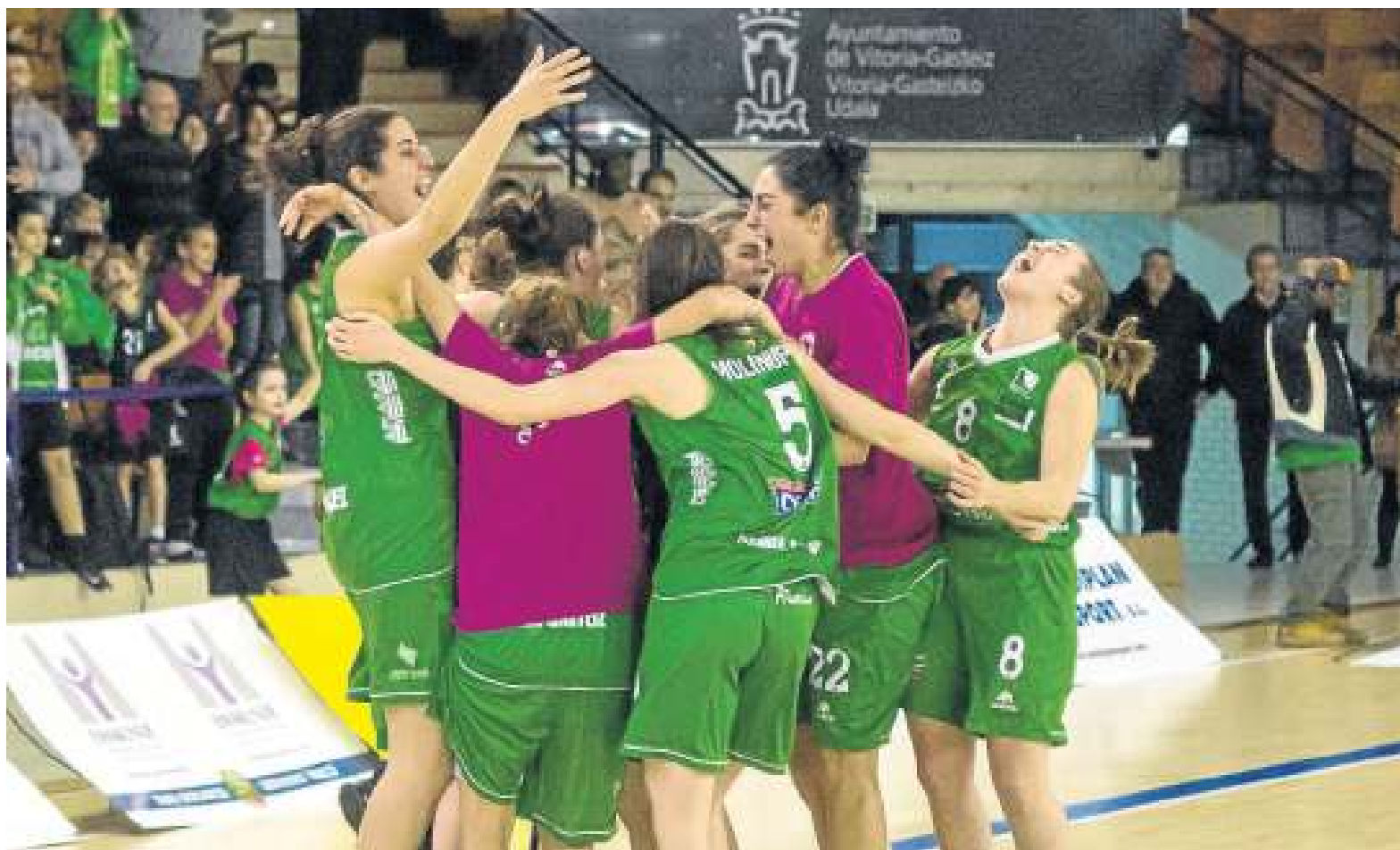
El Araski está cuajando una temporada espectacular a la que quiere poner la guinda con la clasificación para la disputa de los 'play off'.