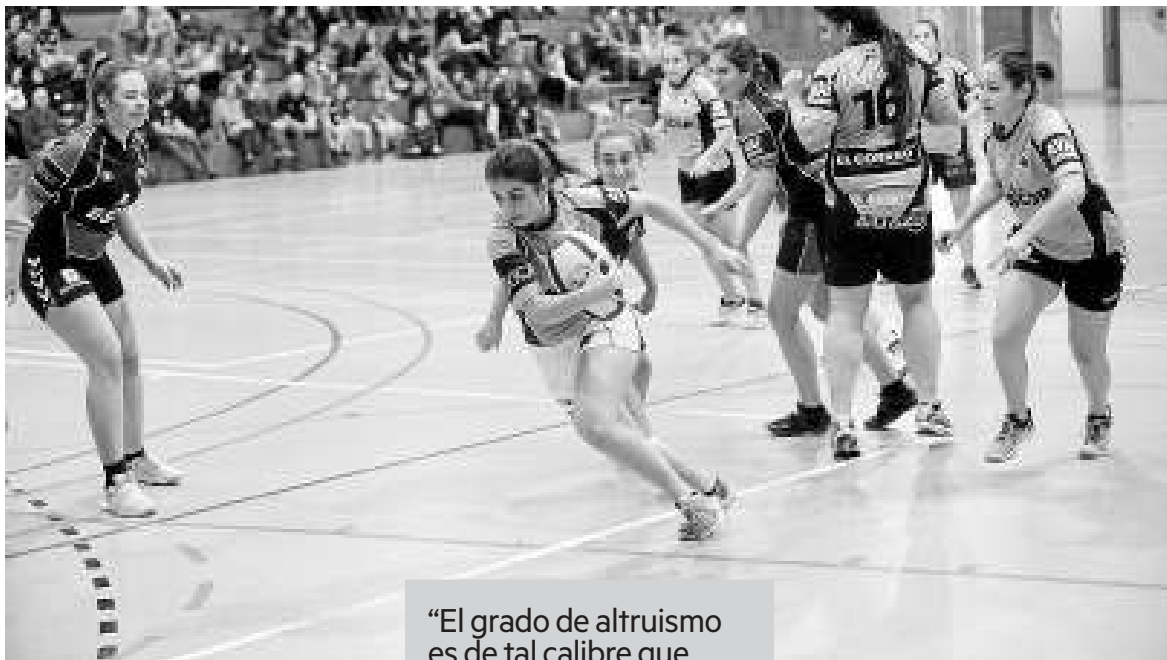
Las jugadoras intercambiaron por

Con la satisfacción del trabajo bien hecho en la primera edición de la jornada Jugonas de Plata , donde integrantes de varios conjuntos de Segunda División (Eharialedea, Gaztedi, Araski y Aurrera) intercambiaron sus papeles durante una tarde, ayer tocaba hacer balance. Y éste no pudo ser más satisfactorio habida cuenta de las dudas que siempre despiertan este tipo de iniciativas. “Estamos más que satisfechas tanto por la repercusión que ha tenido la