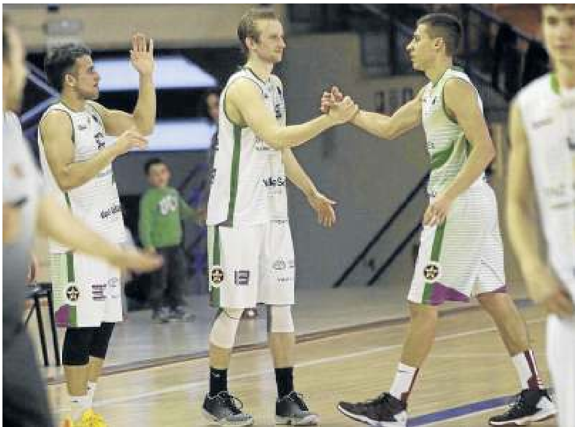
El conjunto vitoriano jugó en cuartos a un altísimo nivel ante el Morón sevillano.