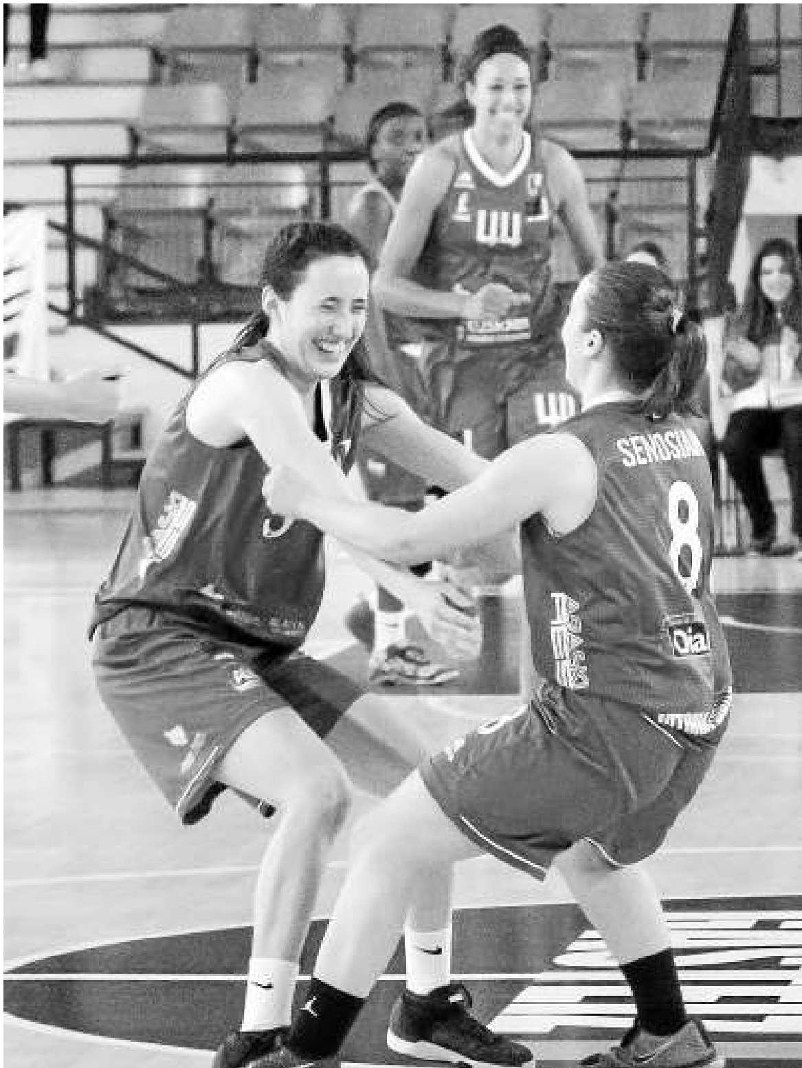
Dos jugadoras del Araski celebran el último y agónico triunfo conseguido en Mendizorroza ante el líder.

Tras la conclusión de la jornada, la número 23, el equipo alavés parará una semana por las vacaciones de Semana Santa y a la vuelta enfilará los últimos tres partidos que se presentan apasionantes para diferentes equipos, unos por la pelea para entrar a los puestos de play-off y otros para lograr la permanencia en la categoría. Pasa entonces,